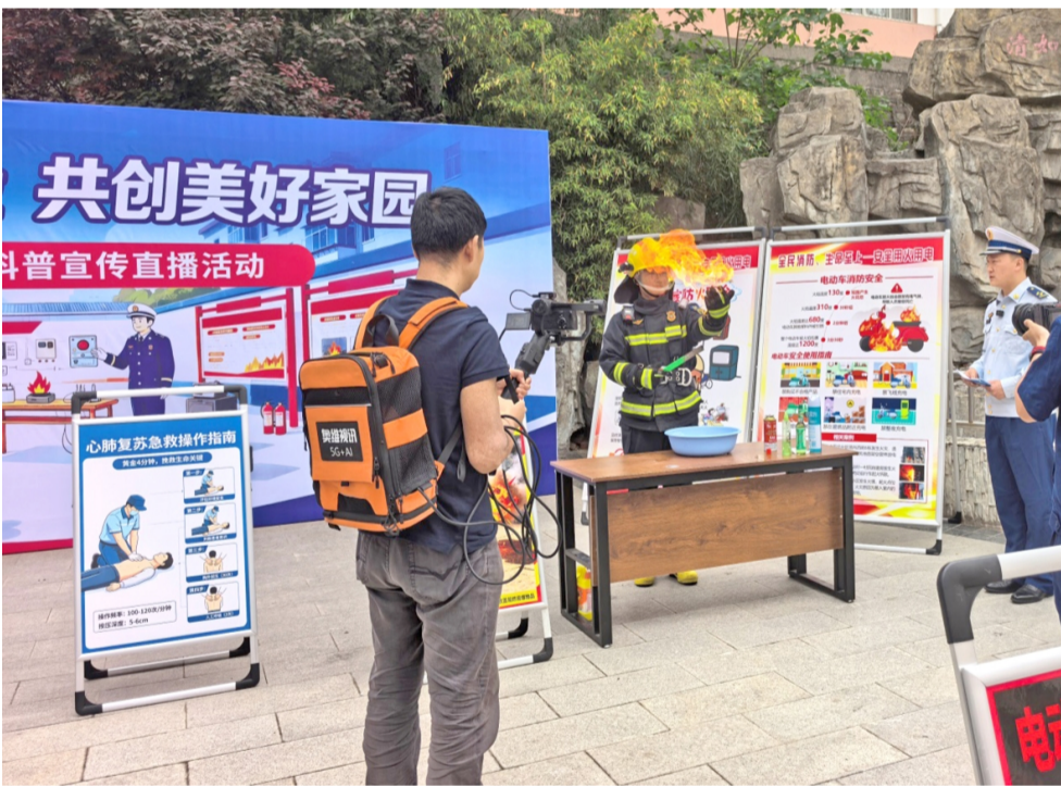
为筑牢辖区安全防线，提高职工住户防灾减灾意识和自救互救能力，华远项目部所属单位联合地方相关单位部门开展防灾减灾共建美好家园宣传活动，物业工作人员与地方专业人员向职工群众科普防灾减灾理念和应急救援与避险知识，把安全知识送到职工群众身边。（宋建民）